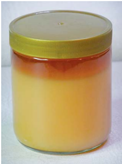
Abb. 2 Mutterlauge.

Das frei verfügbare Wasser in Lebensmitteln, ausgedrückt durch den a_w -Wert, muss unbedingt von Osmose unterschieden werden.